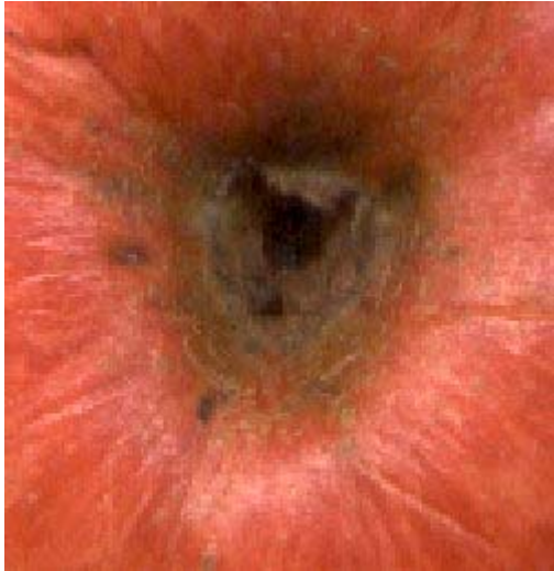
Plaque fauve autour de l'œil. Ici l'épiderme peut être jaune au lieu de rouge